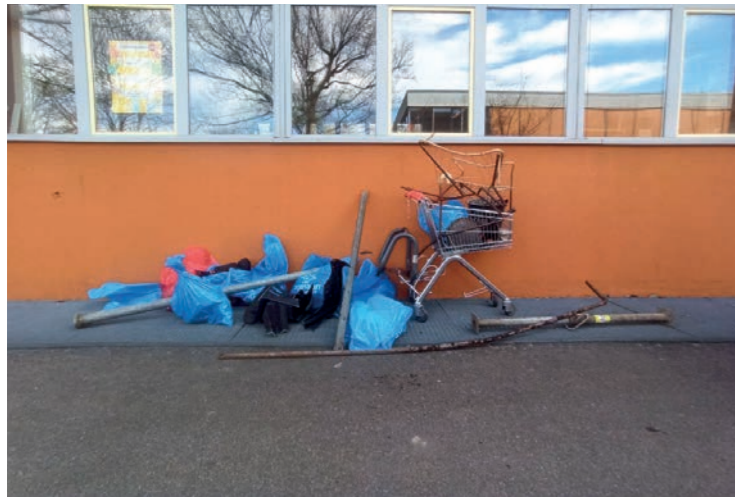
Erfolgreiche Müllsammlung der ASSIII

Am 14.03.2026 wurde in ganz Freiburg wieder Müll gesammelt und auch Landwasser beteiligte sich fleißig. Die Schüler der ASSIII waren am Vortag schon sehr erfolgreich und hatten nach 45 Minuten Sammelaktion rund um den Schulcampus den Müllberg von Foto 1 zusammengetragen!