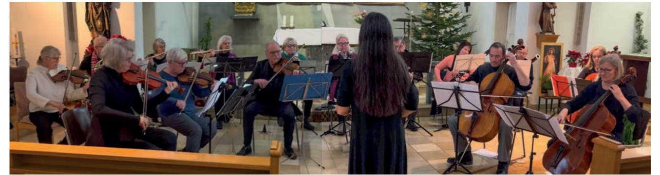
Das Kammerorchester Landwasser

Wir spielen am 8. Mai 2026 um 19:30 Uhr in der katholischen Kirche St. Canisius in unserem Heimatstadtteil Landwasser und am 10. Mai 2026 ebenfalls um 19:30 Uhr im großen Saal der Katholischen Hochschulgemeinde (KHG) in der Lorettostraße.