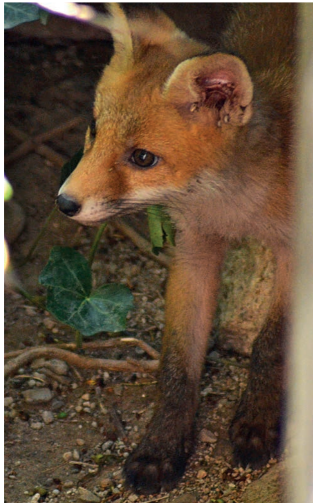
Fuchsjunges vor dem Bau (und mit Zeckenbefall am Ohr)

stinkt – ich hatte vor einigen Jahren einen Bau direkt vor meinem Büro im Institutsviertel. Dort gelang mir auch das Foto von dem kleinen Fuchswelpen, das ich für den Artikel verwendet habe.