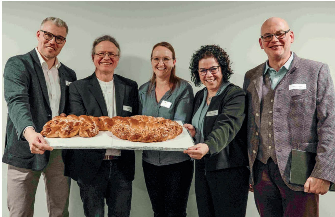
Der Vorstand übergab zur Eröffnung einen symbolischen Hefezopfschlüssel an die Schulleitung.