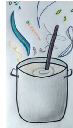
Zeichnung zur Begegnungsküche

Haus der Begegnung Habichtweg 48, Telefon 0761/13 15 49 sekretariat@hdb-freiburg.de www.hdb-freiburg.de