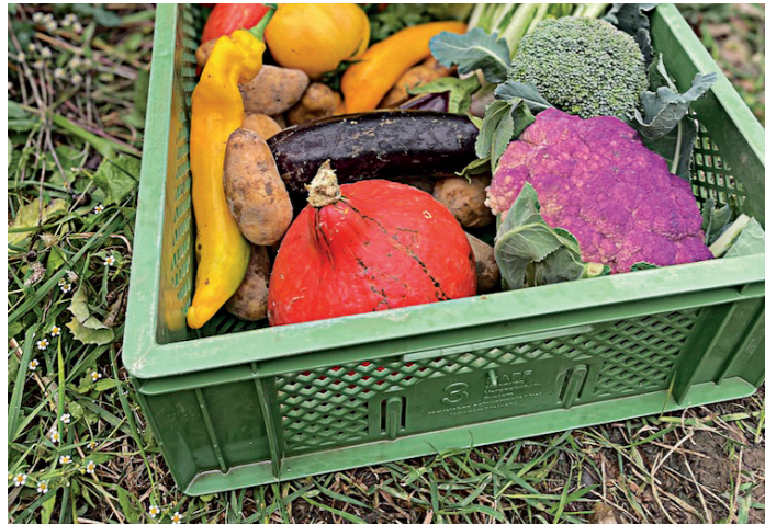
Jede Woche frisches Gemüse aus der Region