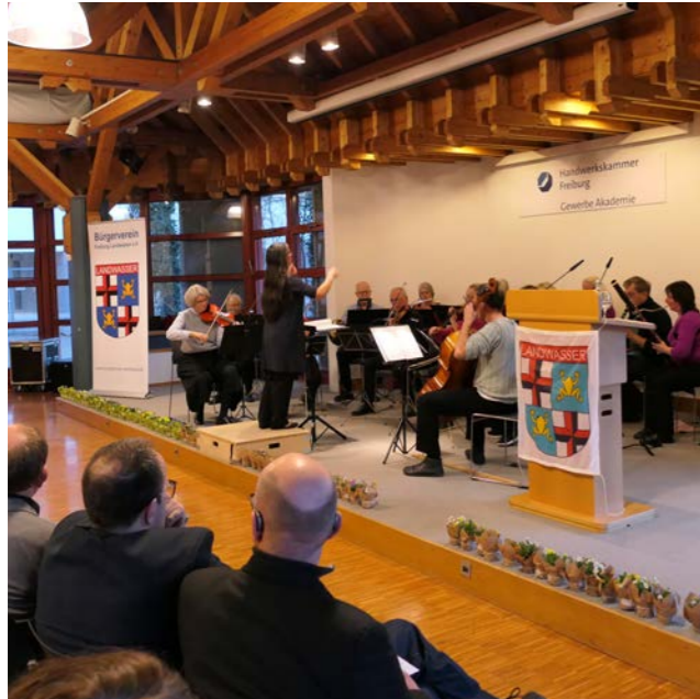
Das Kammerorchester Landwasser eröffnete den Frühlingsempfang mit einem Stück aus der „Wassermusik“ von Händel

Zum ersten Mal fand am 19. März 2026 der Frühlingsempfang in der Gewerbeakademie in der Wirthstraße statt. Viele Gäste haben den Weg gefunden. Das Kammerorchester Landwasser überraschte wieder mit neuen flotten Musiken.