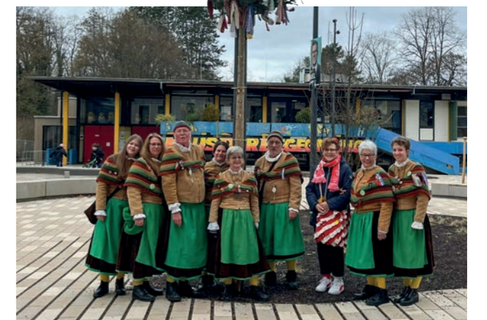
Drei ausgediente Weihnachtsbäume wurden in Narrenbäume umgewandelt. Davor die Zunft der Mooswaldwiibli.

Rathausplatz können diese Bäumchen natürlich nicht konkurrieren. Eine entsprechende Vorrichtung, wie sie es im alten EKZ noch gab, war in der Planung für das neue Zentrum wohl auch nicht vorgesehen und uns würde zudem die erforderliche Manpower fehlen. Am Schmutzigen Donnerstag schnurrten wir wie gewohnt wieder durch Landwasser um Spenden für die Kinderfasnet zu sammeln.