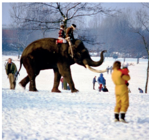
Ein Elefant am zugefrorenen Moosweiher (Klaus Kienzler)

Ein Elefant spazierte durch Landwasser – hier im tiefsten Winter am Moosweiher. Er war in den 1980er Jahren Patient in der damaligen Großtierklinik am Tierhygienischen Institut. Für Furore sorgte er auch auf der zur Tierklinik gehörenden Wiese an der Elsässer Straße und so mancher rieb sich ungläubig die Augen, der dort entlang fuhr. Das muss allerdings in der wärmeren Jahreszeit gewesen sein, vermutlich war er des Öfteren zu Gast.